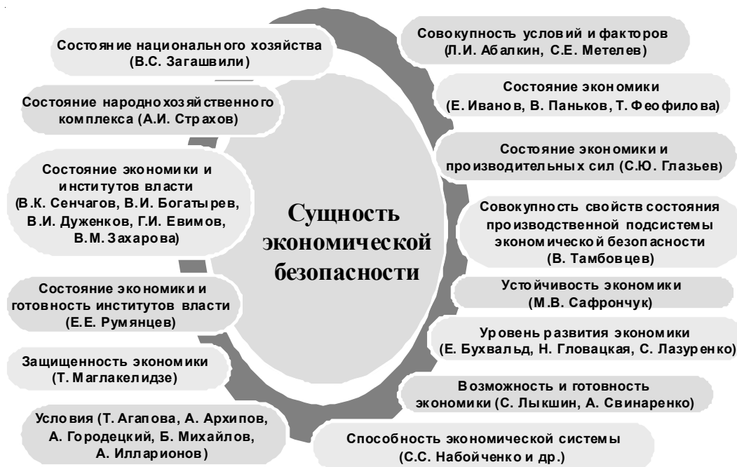
Рис. 1. Примеры трактовки сущности экономической безопасности 3

Национальные интересы России в сфере экономики на долгосрочную перспективу заключаются в повышении конкурентоспособности национальной экономики (ст. 21 Стратегии). Среди приоритетов устойчивого развития (ст. 24) – «экономический рост» 4 . В качестве стратегических целей обеспечения национальной безопасности применительно к экономическому росту определены (ст. 53) «вхождение России в среднесрочной перспективе в число пяти стран-лидеров по объему валового внутреннего продукта, а также достижение необходимого уровня национальной безопасности в экономической и технологической сферах». Достигается экономический рост (ст. 54) «путем развития национальной инновационной системы, повышения производительности труда, освоения новых ресурсных источников, модернизации приоритетных секторов национальной экономики, совершенствования банковской системы, финансового сектора услуг и межбюджетных отношений в Российской Федерации». И далее (ст. 58): «для обеспечения национальной безопасности за счет экономического роста Российская Федерация основные усилия сосредоточивает на развитии науки, технологий и образования, совершенствовании национальных инвестиционных и финансовых институтов в интересах достижения необходимого уровня безопасности в военной, оборонно-промышленной и международной сферах».